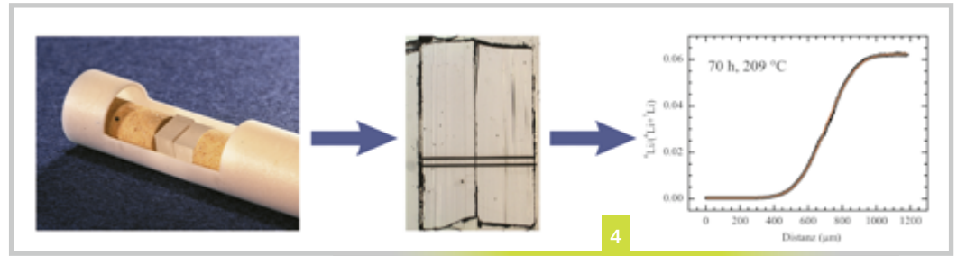
Abbildung 4 Vom Experiment über die Analyse zur Bestimmung von Beweglichkeiten von Lithiumisotopen

sermolekülen, die bei Gehalten von mehreren Gewichtsprozent überwiegen. In offenen Netzwerkstrukturen können die Wassermoleküle zwischen verschiedenen Hohlräumen hin und her springen und dort wiederum temporär mit Netzwerksauerstoff reagieren. Dadurch wird das ansonsten starre Netzwerk lokal flexibel gemacht.