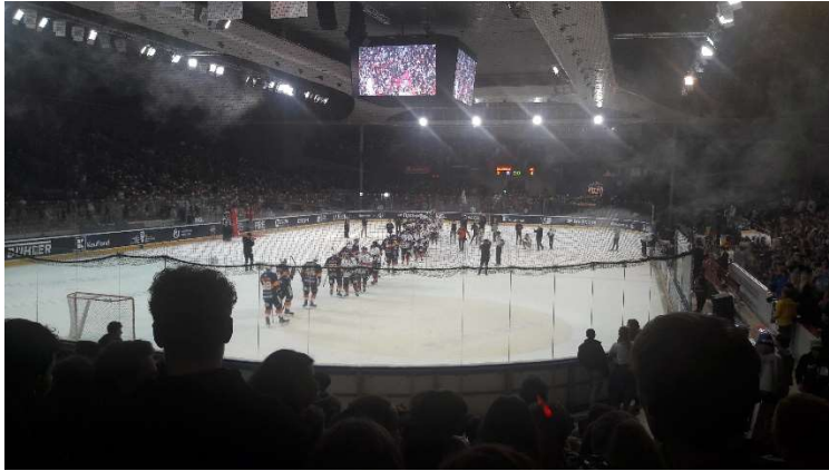
Beim Battle of Prague treten vier verschiedene Prager Unis im Icehockey gegeneinander an

bestand bei mir und bei meinen Freunden allerdings nicht allzu regelmäßig Kontakt zu den Buddies, also mach dir nichts draus, wenn du keinen abbekommen solltest. Außerdem organisiert der ESN auch viele weitere Aktivitäten wie Trips in andere Städte oder besondere Aktivitäten und Sportveranstaltungen. Ich habe dabei sogar bei relativ vielen Sachen teilgenommen und am besten hat mir montags das Floorball gefallen. Auch wenn ich keine Ahnung von dem Sport hatte und die Finnen das Spiel fest im Griff hatten, hat mir der Sport und auch das Bier danach immer viel Spaß bereitet.